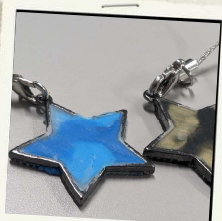
キーホルダー ストラップづくり